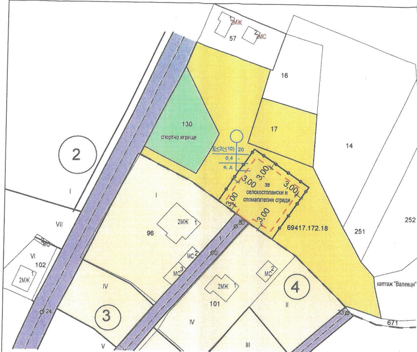
ПЛАН ЗА ЗАСТРОЯВАНЕ М 1:1000 - ИДЕЙНО ПРЕДЛОЖЕНИЕ